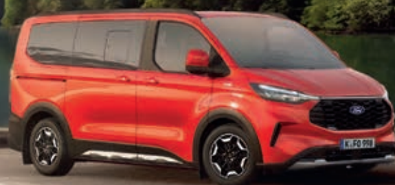
FORD TOURNEO CUSTOM € 285,- mtl.*