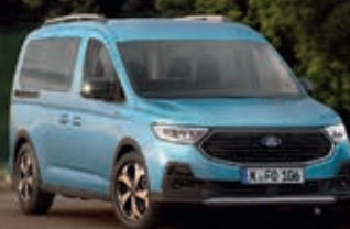
FORD TOURNEO CONNECT € 195,- mtl.*