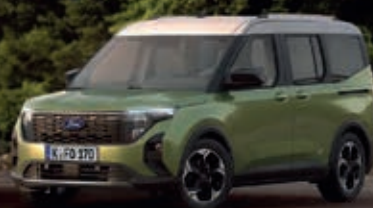
FORD TOURNEO COURIER € 175,- mtl.*

Die Ford Tourneo Familie. Jetzt mit 0 % effektivem Jahreszins!